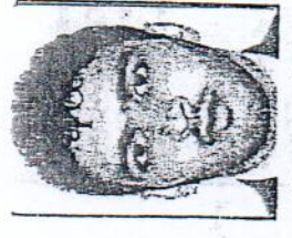
V-President / بسم الله Bismelliah

جواز تشبث Business License عصر کابل شمال لمیتد Asri Kabul Shamal Ltd