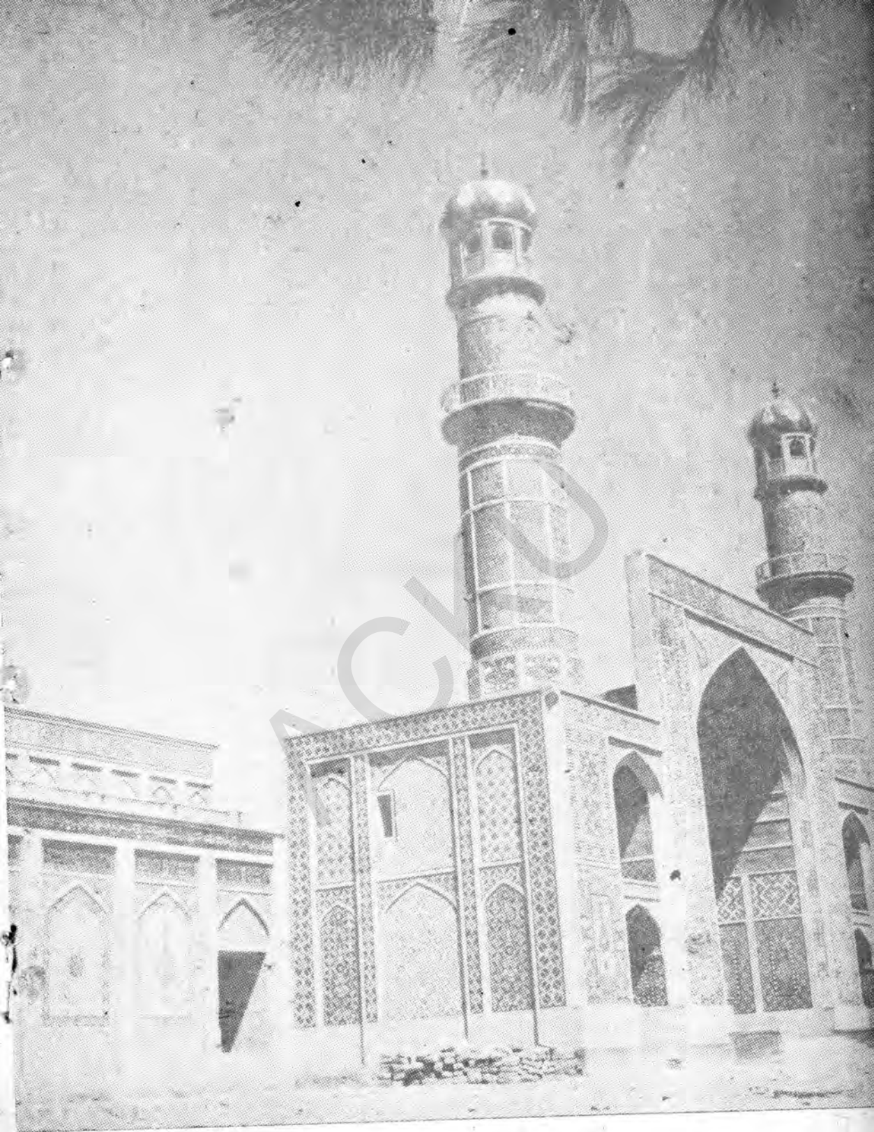
گوشه از مسجد جامع هرات